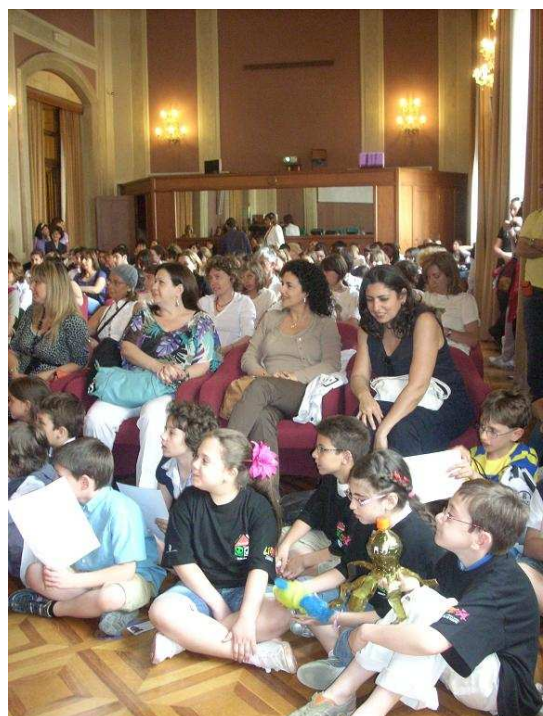
Un momento della premiazione