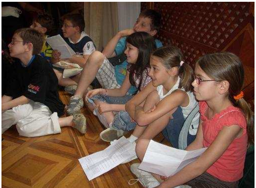
Un momento della premiazione

Oltre ai vincitori sono state assegnate anche sei menzioni speciali. Per le Scuole Primarie, menzione per la Scuola Cencelli di Sabaudia - Parco del Circeo con la filastrocca "Re Zozzalone" e per la Scuola G. Agnelli di Lodi (LO) 2 A con un lavoro denuncia "Striscia l'immondizia" Per le scuole secondarie di Primo Grado menzioni per la SMS C.Levi di Napoli (Scampia) (NA) per discariche e fumi alla periferia nord di Napoli ed alla IC G.Pascoli di Felizzano (AL) "TG Terra 26" 2ª. Infine per i racconti sull'ecomafie categorie scuole secondarie di II gra-