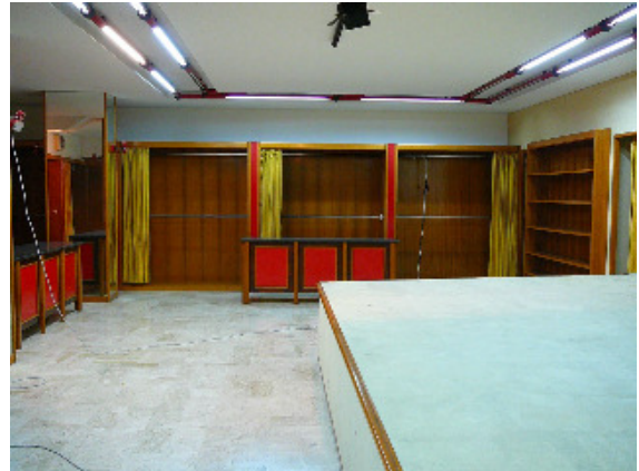
Lo stato di avanzamento dei lavori