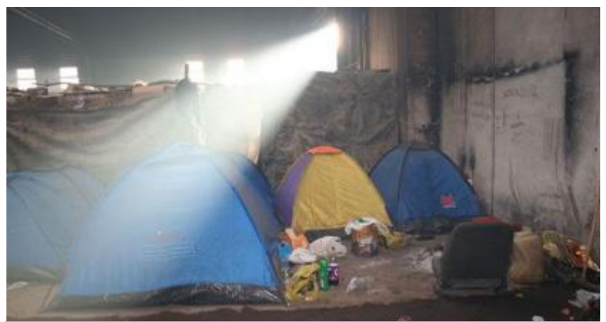
Dormitorio degli immigrati a Rosarno

Massimo Numa su La Stampa | 9 gennaio 2010