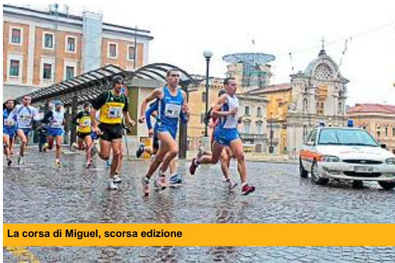
La corsa di Miguel, scorsa edizione

La Corsa di Miguel, inserita nel calendario nazionale della Fidal e patrocinata dal Comune di Roma e dalla Provincia di Roma, dalla Regione Lazio, dal II e XX Municipio, aspetta al via