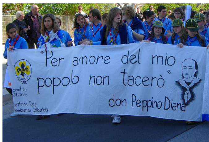
Bari, 15 marzo 2008

Il 10 e 11 maggio Libera organizza a Roma presso il mercato di Porta Portese "Legalità a tavola - Viaggio dei sapori nell'Italia antimafia". Incontro con Libera, proiezione di video, spazi informativi, degustazione dei prodotti di Libera Terra.