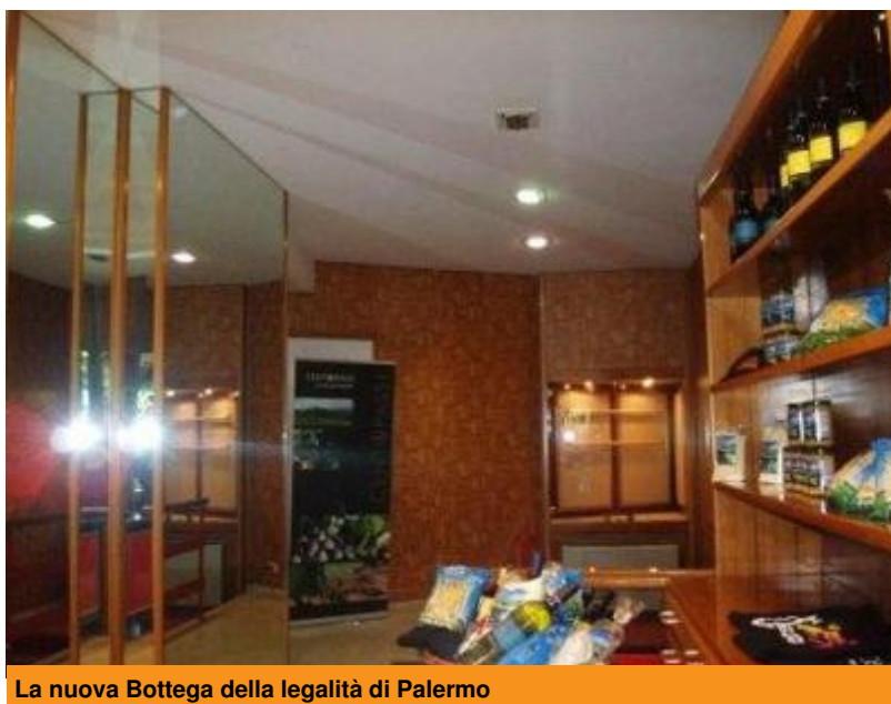
La nuova Bottega della legalità di Palermo