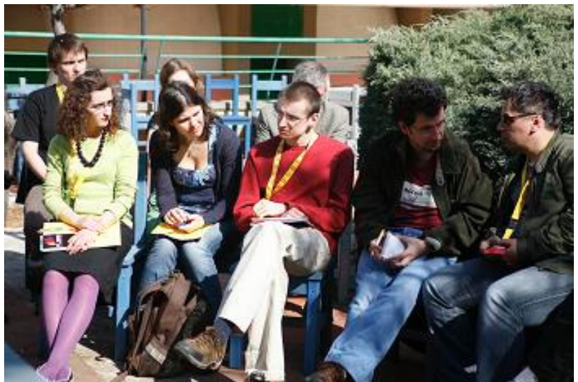
Assemblea all'aperto di FLARE a Bari

A Bruxelles, a giugno 2008, nella stessa sede del Parlamento Europeo ci sarà la consacrazione politica della Rete e l'ultima fase del programma che, tra le attività, prevede la firma dell'atto costitutivo e dello statuto e la definitiva consacrazione anche formale del network.