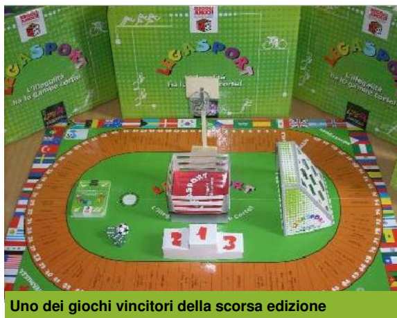
Uno dei giochi vincitori della scorsa edizione

La giornata di premiazione della seconda edizione di Regoliamoci si terrà a Roma la mattina di giovedì 2 ottobre 2008.