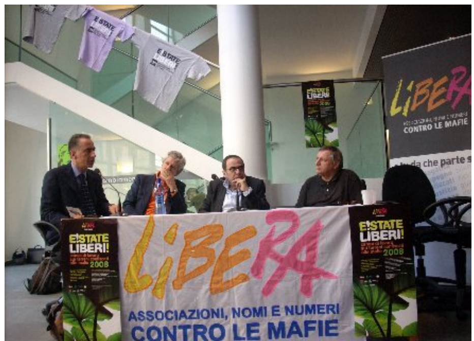
Conferenza stampa di presentazione dei campi

Accanto al lavoro manuale vengono organizzati dei momenti di formazione e informazione sui temi della legalita' , dell'uso sociale dei beni confiscati, delle mafie. La sera infine diventa momento di incontro e confronto tra i volontari e tra i volontari e le comunita' locali attraverso iniziative di animazione territoriale e socialita'.