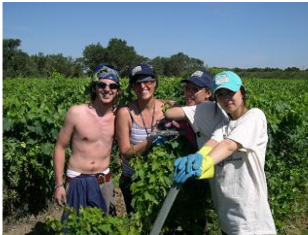
Lavori sui terreni confiscati in Puglia

Quest'anno i campi saranno tre. I primi due inizieranno a fine giugno, l'ultimo ad agosto. Diversi gruppi di scout e di studenti provenienti da