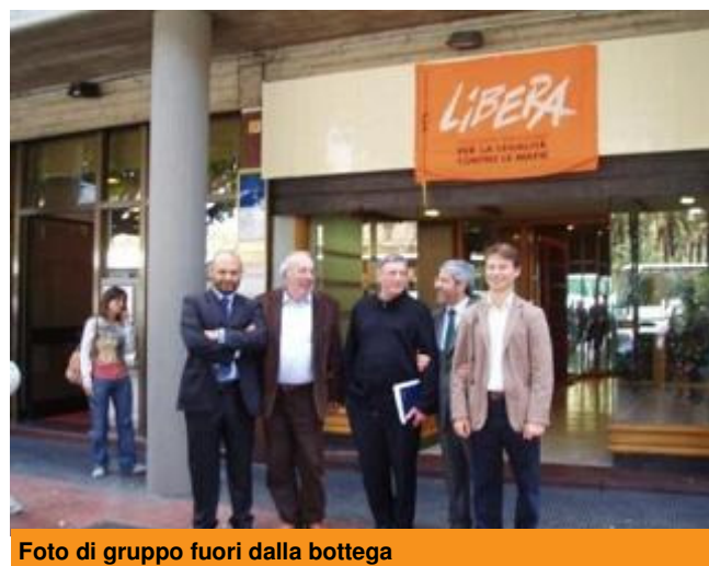
Foto di gruppo fuori dalla bottega

Un destino libero dalla vigliacca presenza mafiosa e che, probabilmente, è racchiuso anche dentro quelle chiavi che oggi sono state consegnate.