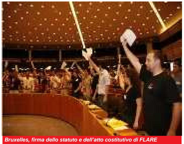
Bruxelles, firma dello statuto e dell'atto costitutivo di FLARE