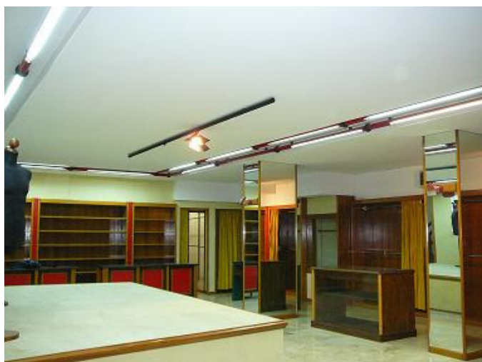
Bottega dei sapori e saperi della Legalità nel cuore di Palermo

Un ultimo importante segnale viene dai campi estivi, dove ragazzi da tutta Italia sono già impegnati nel lavoro delle terre e in attività sui temi della legalità, a dimostrazione che le reti locali dell'antimafia possono contare su una solidarietà che va ben oltre i confini di una regione.