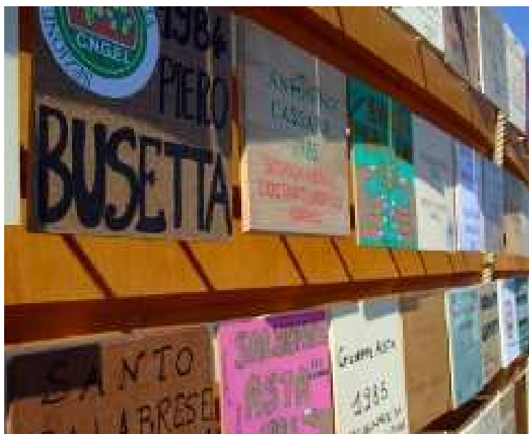
I lavori realizzati per il 21 marzo di Bari

Per informazioni: educazionelegalita@libera.it, campania.21marzo@libera.it oppure telefonare a 0817968801 - 0817968732 - 0817968734