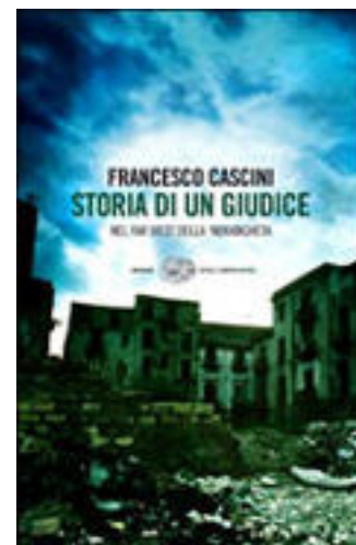
Storia di un giudice di Francesco Cascini, ed. Einaudi

contare cosa significa essere un rappresentante dello Stato nella terra della 'ndrangheta, e per farlo rinuncia ai facili moralismi e alla retorica per privilegiare uno stile diretto. E alla fine è impossibile non condividere le parole dell'autore: «La sensazione di trovarsi in mezzo a una guerra prendeva sempre più corpo. Una guerra di cui non fregava niente a nessuno».